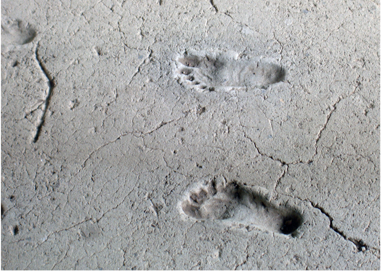
Arqueología e Historia