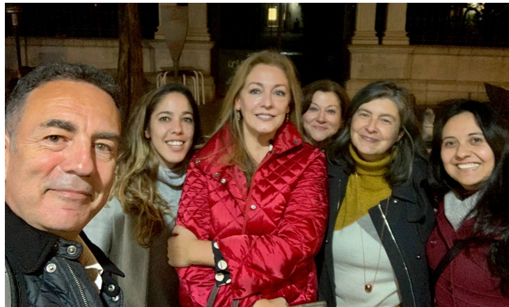
reunión del 15 de diciembre 2021